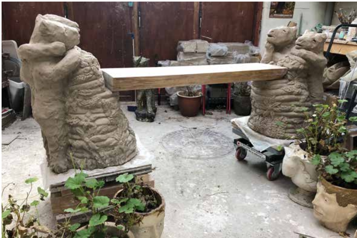
Pontus og Tine: Bænk i stentøj og egetræ til Havrehedskolen under arbejde i Tines atelier, 2021