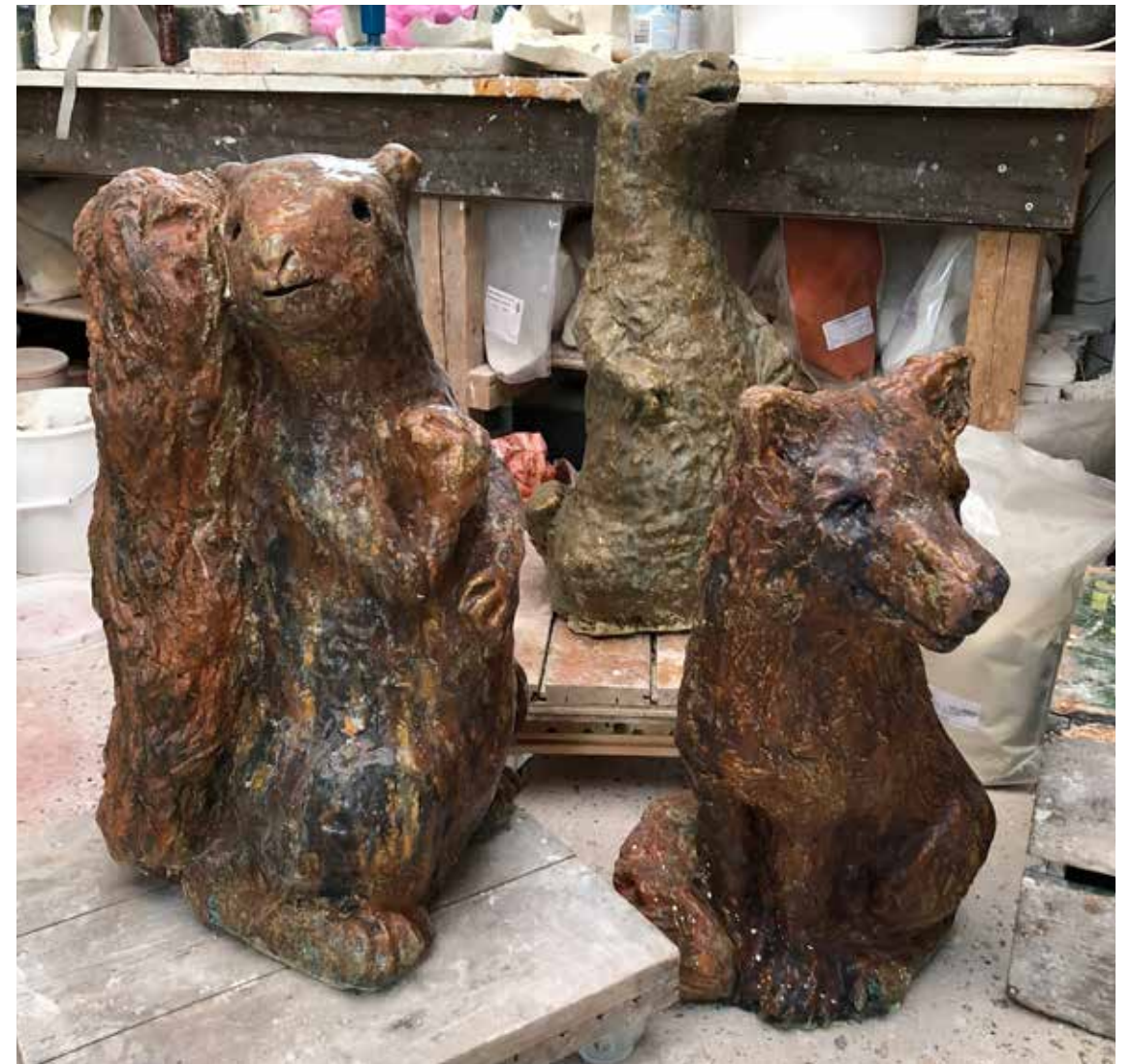
Egern, Odder og Ræv til børnehave i Kviberg udenfor Göteborg, glaseret stentøj, h. ca.70cm, 2020