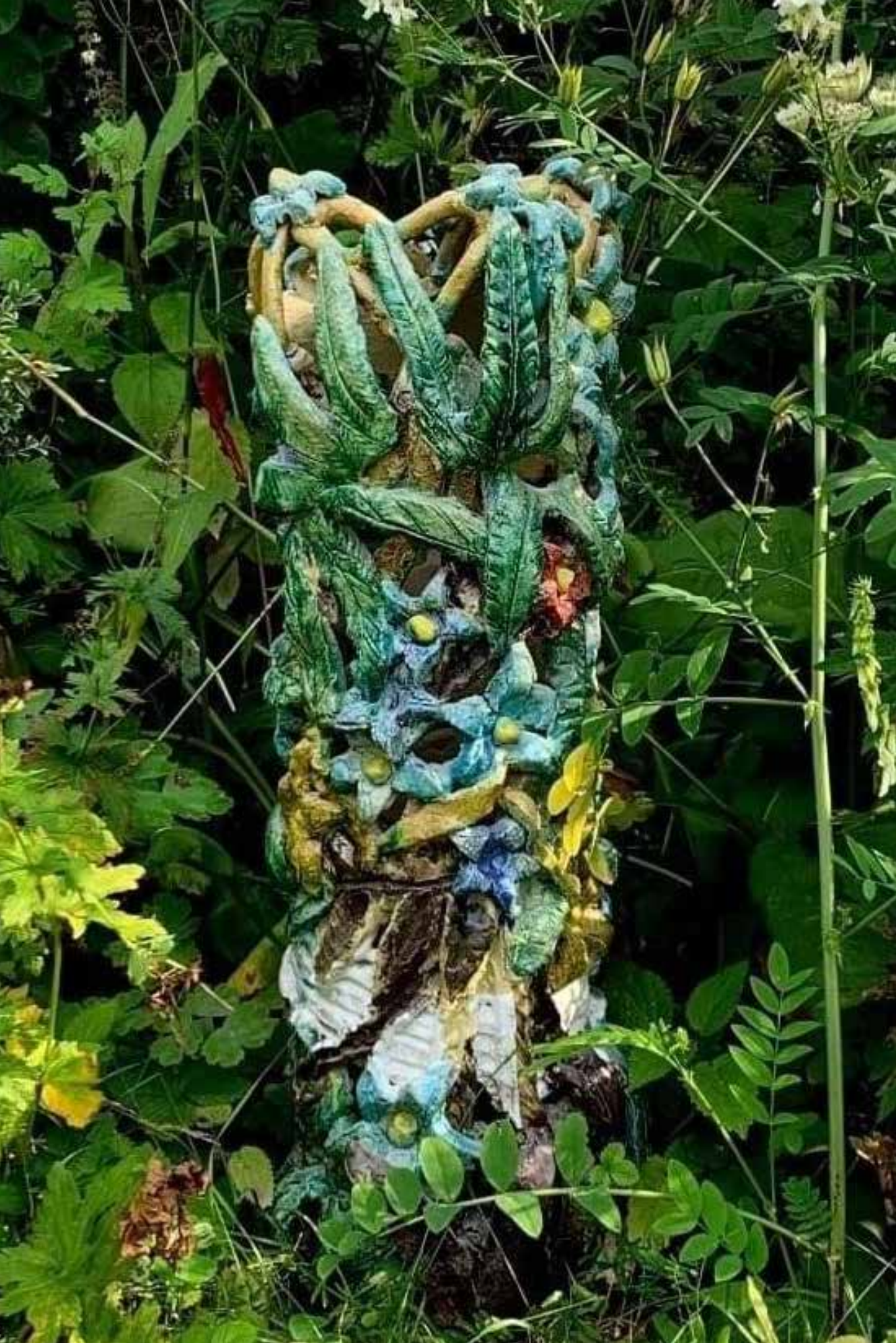
Tine: Blomstrende træstamme, 62cm, 2012