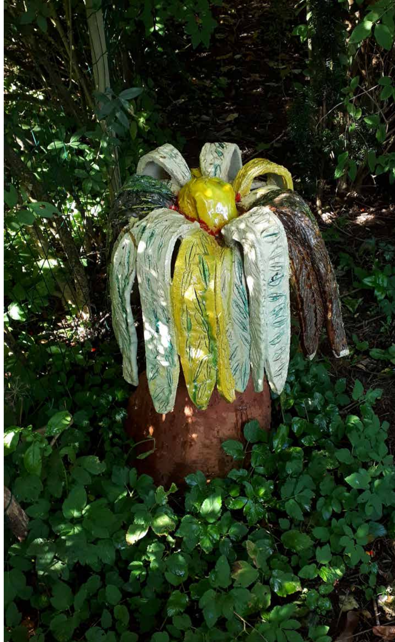
Tine: Stor blomst, stentøj, 67cm, 2013