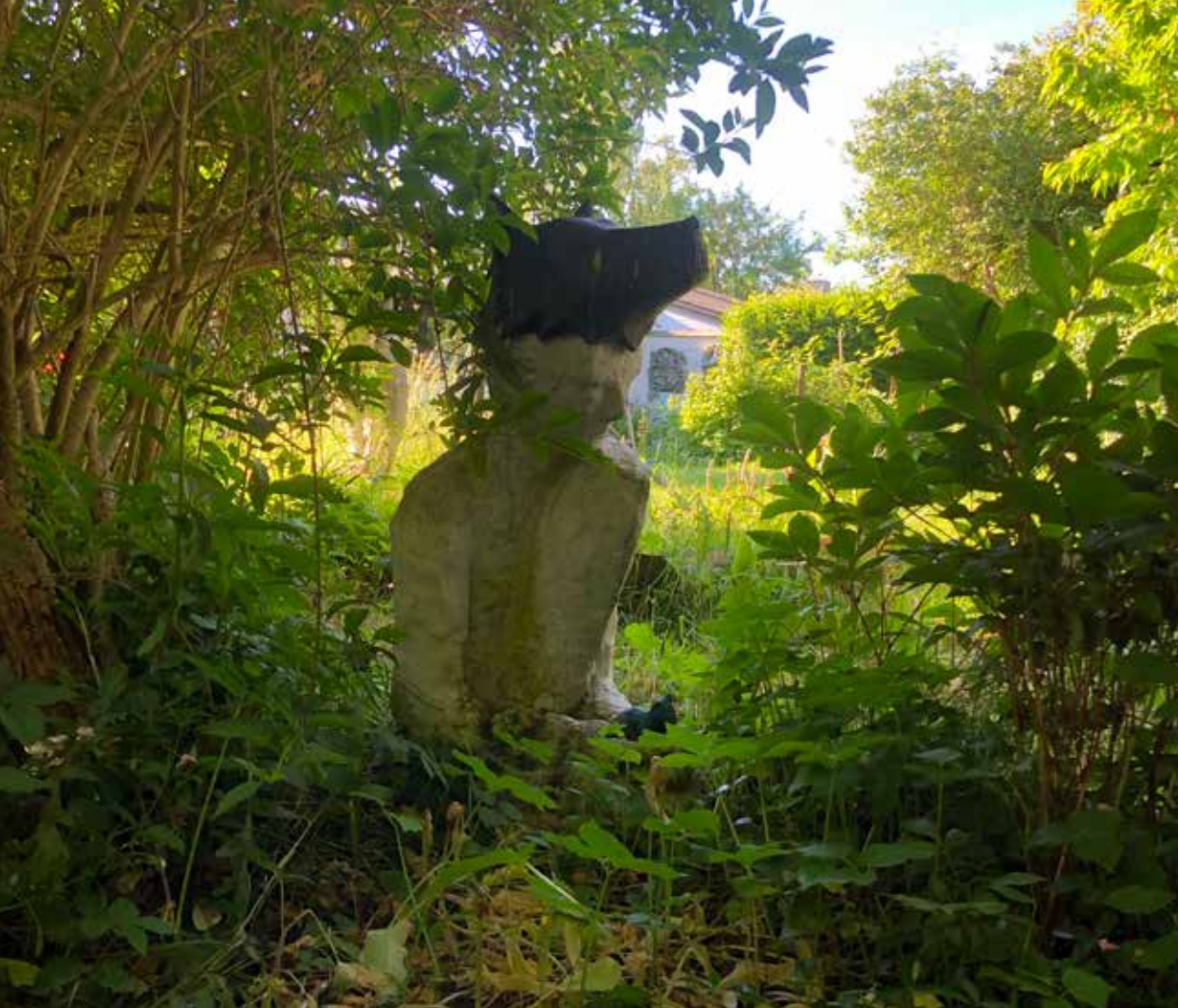
Billedhuggeren/Ulven, 1988, 95cm