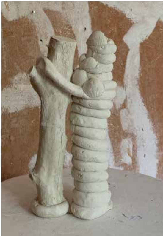
Tine: Dobbeltfigur, vist på Richard Withers hus 2019, 32 cm