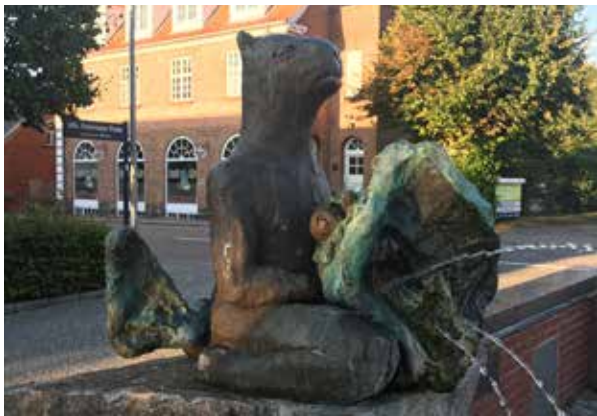
Pontus: Vandkunst i Høng 1996