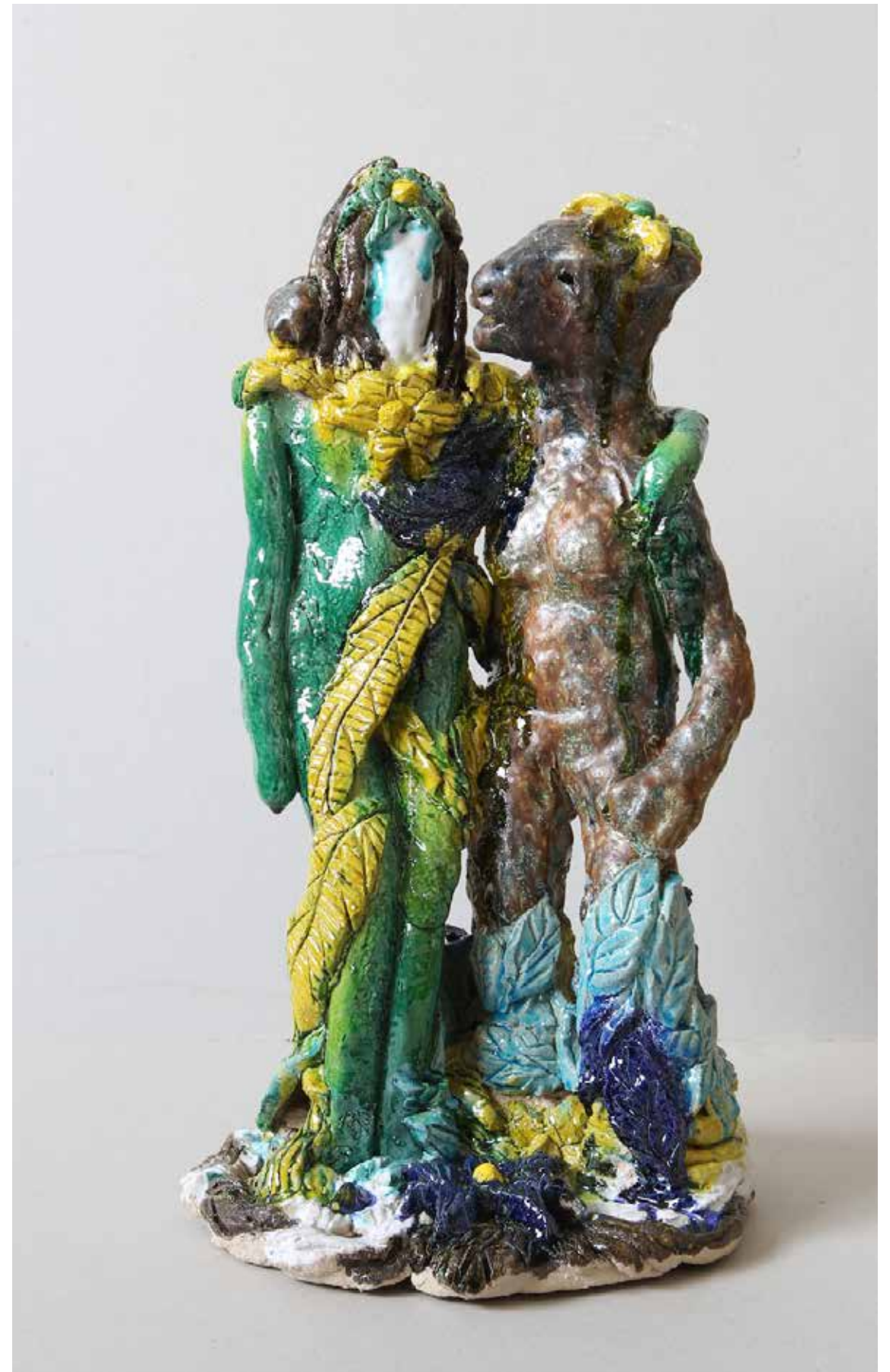
Tine og Pontus: Sommer på silkevejen, 51cm, 2016