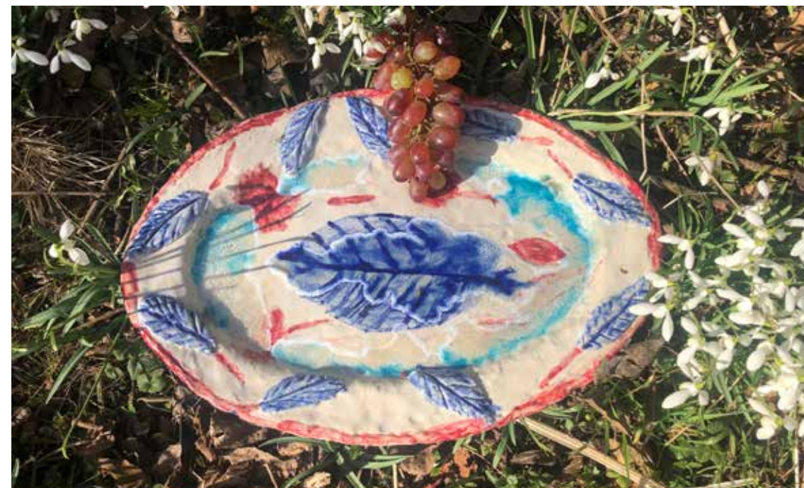
Tine: Fiskefad, stentøj, 7x29x44cm, 2020